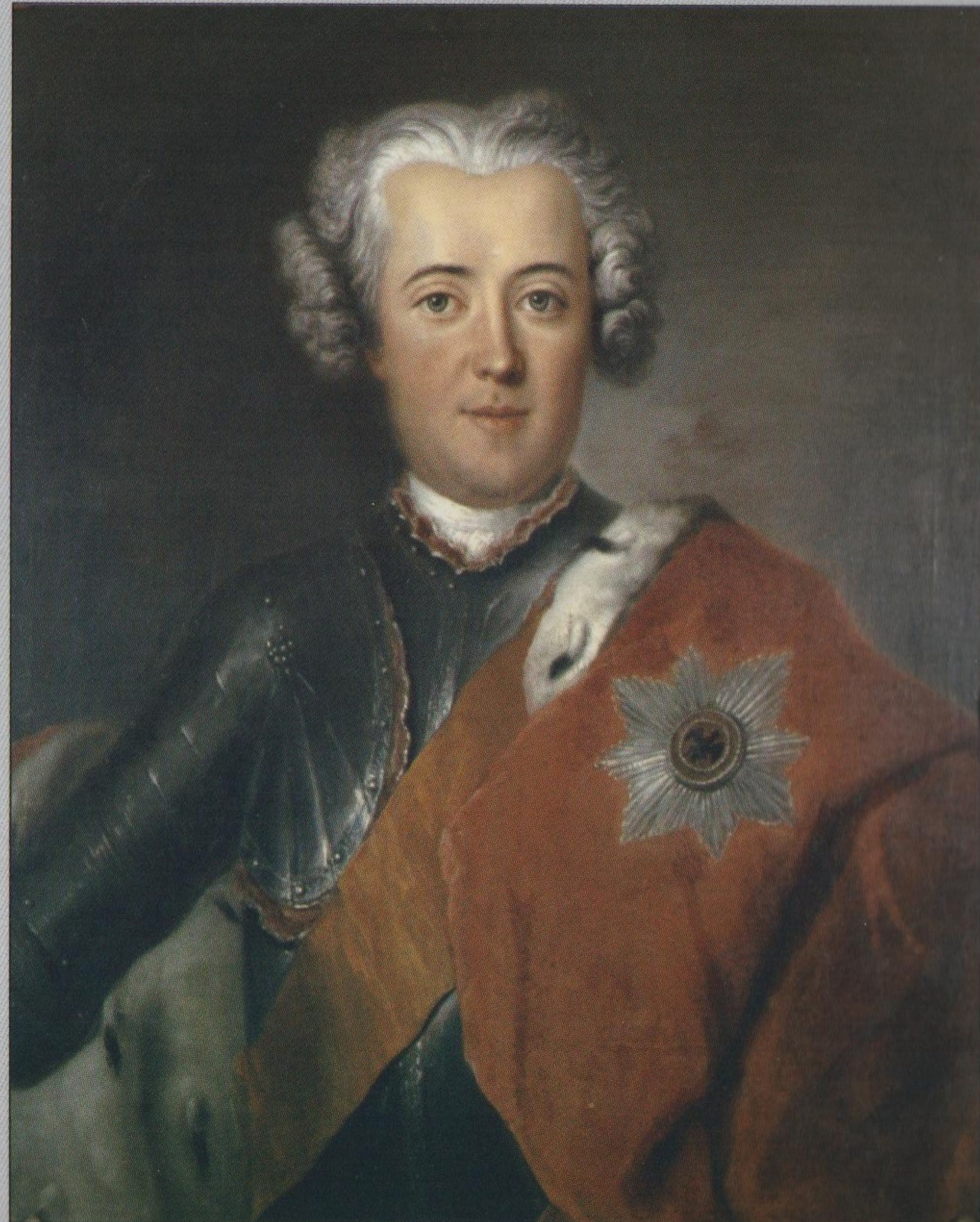
Antoine Pesne Kronprinz Friedrich II

Stiftung Preußische Schlösser und Gärten Berlin- Brandenburg