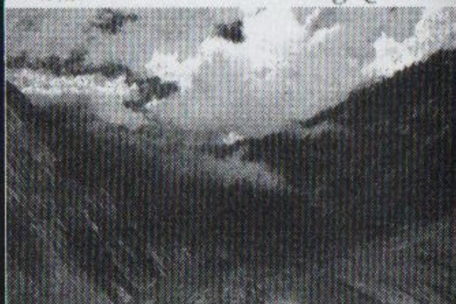
Akademos String Quartet

Acte Préalable Beethoven Szymanowski String Quartets