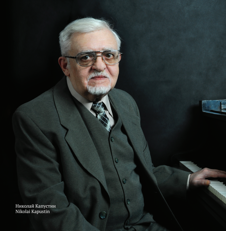
Николай Капустин Nikolai Kapustin