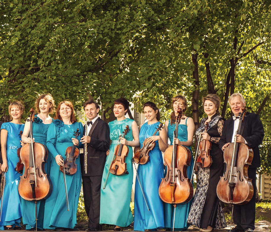
Камерный оркестр Вологодской филармонии The Chamber Orchestra of the Vologda Philharmonic Society